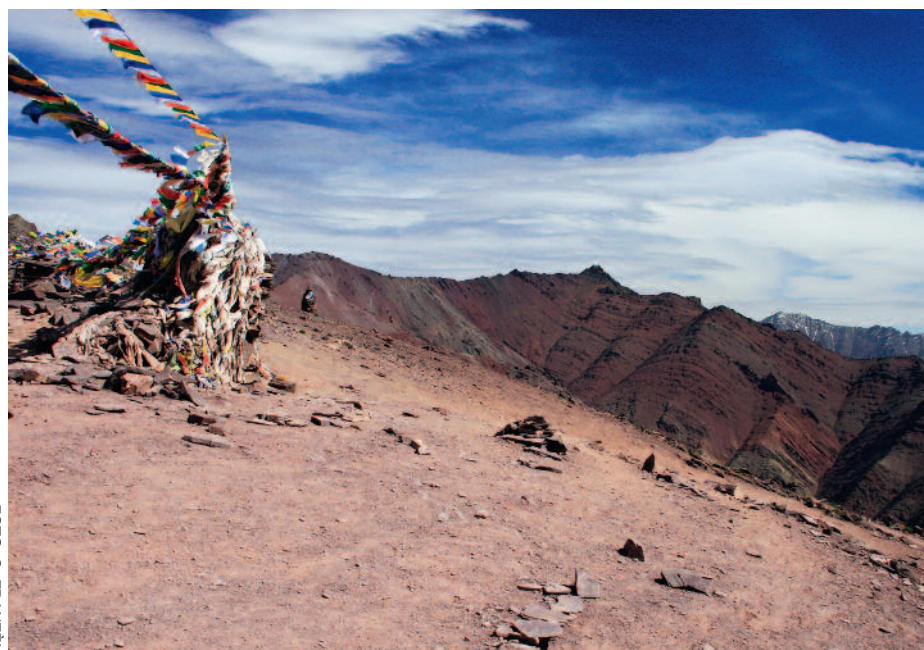
Knutpunkten tar oss till oanade höjder.